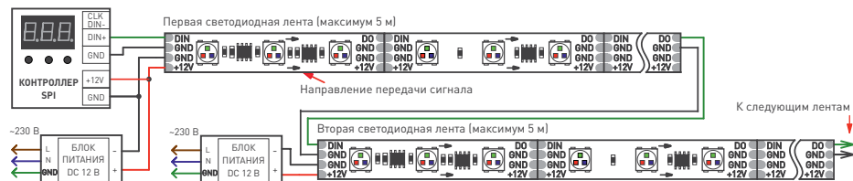
Рис. 2. Схема подключения ленты при управлении от внешнего контроллера