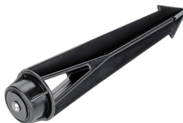
Рис. 3. Основание для установки в грунт (ALT-SPIKE-175, арт. 024888)