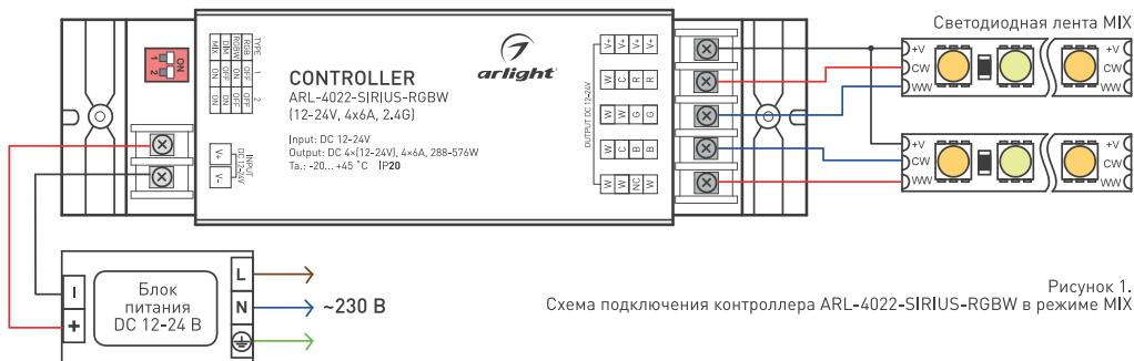
Рисунок 1. Схема подключения контроллера ARL-4022-SIRIUS-RGBW в режиме MIX