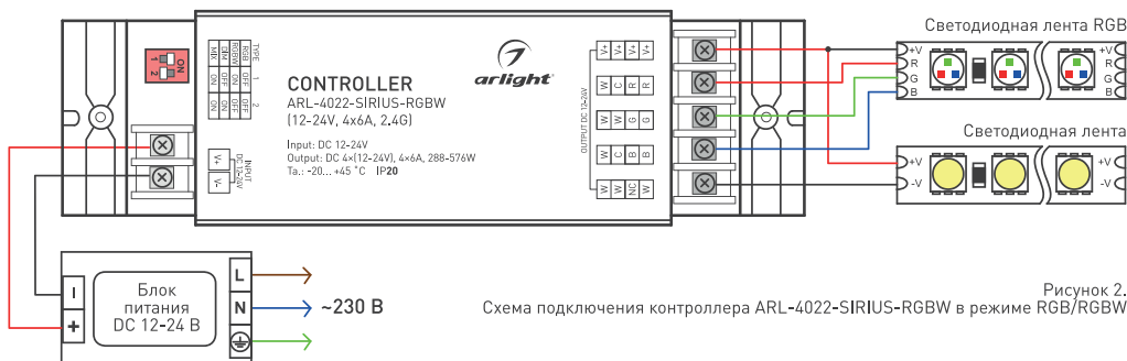
Рисунок 2. Схема подключения контроллера ARL-4022-SIRIUS-RGBW в режиме RGB/RGBW