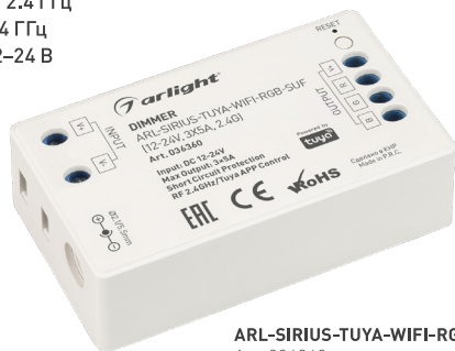
ARL-SIRIUS-TUYA-WIFI-RGB-SUF Art. 036360