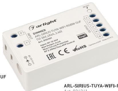
ARL-SIRIUS-TUYA-WIFI-RGBW-SUF Art. 036361