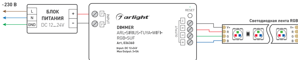
Рисунок 1. Пример схемы подключения диммера ARL-SIRIUS-TUYA-WIFI-RGB-SUF