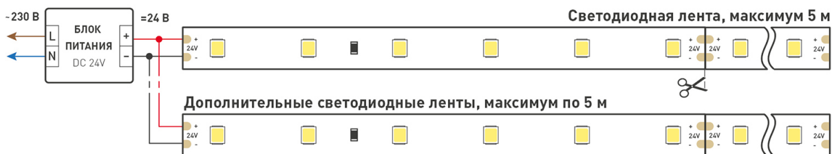
Схема 1. Подключение нескольких светодиодных лент с одной стороны.

Максимальная длина подключения ленты – 5 м (1 катушка).