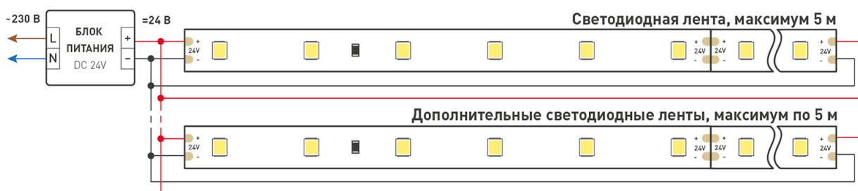
Схема 2. Подключение нескольких светодиодных лент с двух сторон.

Рекомендуется использовать для обеспечения равномерного свечения ленты по всей длине.