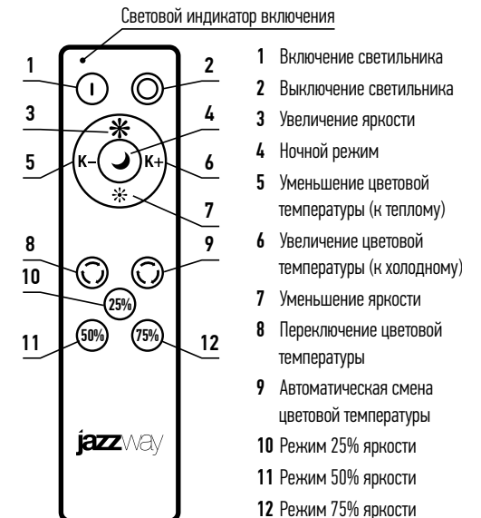
Пульт дистанционного управления (ДУ)