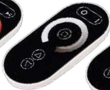
ARL-1022-SIRIUS-DIM Арт. 027146