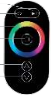
Рисунок 1. Внешний вид пульта дистанционного управления и назначение органов управления.