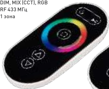
ARL-1022-SIRIUS-RGB Арт. 023170