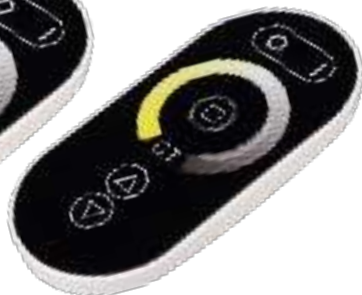
ARL-1022-SIRIUS-MIX Арт. 027147